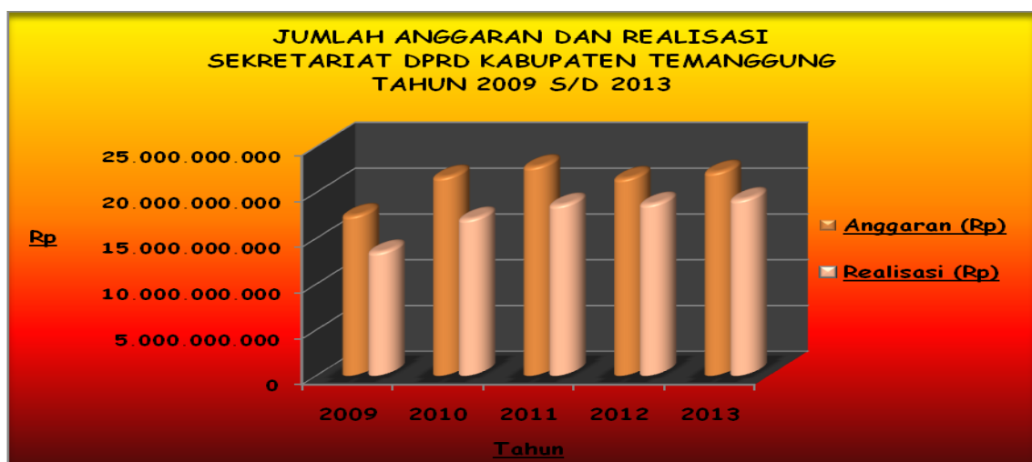
Gambar 2.2 Anggaran dan Realisasi Pendanaan Sekretariat DPRD Kabupaten Temanggung Tahun 2009–2013